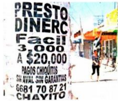
El fraude opera a partir de préstamos con tasas impagables, mayores a 180% a la semana.