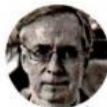
JOSÉ ANTONIO CRESPO Político

“Nuestra clase política no asume con responsabilidad la construcción de agendas públicas... Es un problema estructural de nuestro sistema político presidencialista”