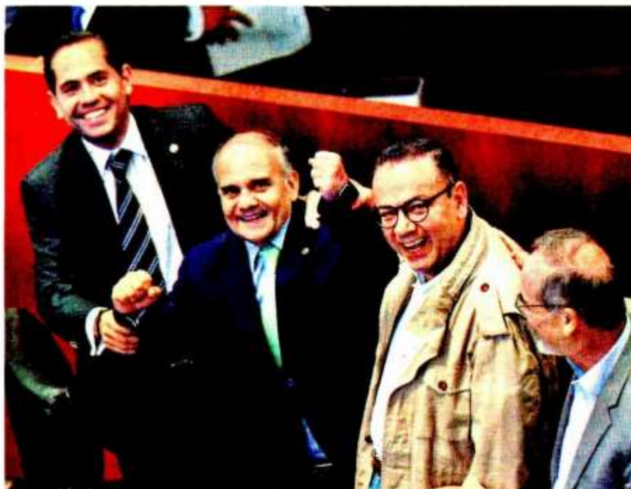
El nuevo líder de la bancada tricolor ayer en el Senado. CUARTOSCURO

FUENTE: Senado • GRÁFICO: Alfredo San Juan