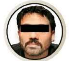
Ovidio Guzmán López Ex líder del cártel de Sinaloa