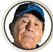
Rafael Caro Quintero Fundador del cártel de Guadalajara