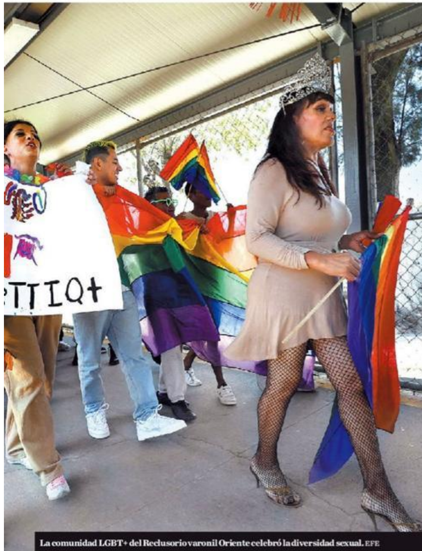
La comunidad LGBT+ del Reclusorio varonil Oriente celebró la diversidad sexual.