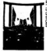
El Congreso mexicano dejó de donar recursos a la Copa a finales del año 2019.