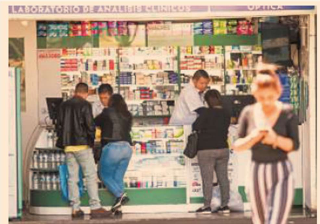
El gasto de bolsillo que realizan las familias como consecuencia de la quinta ola del Covid-19 presionó la inflación.

En el caso de la ropa y el calzado, el incremento en su precio fue de 5.60%, a la vez que la educación y el esparcimiento aumentaron en 4.08% y la vivienda 2.25 por ciento.