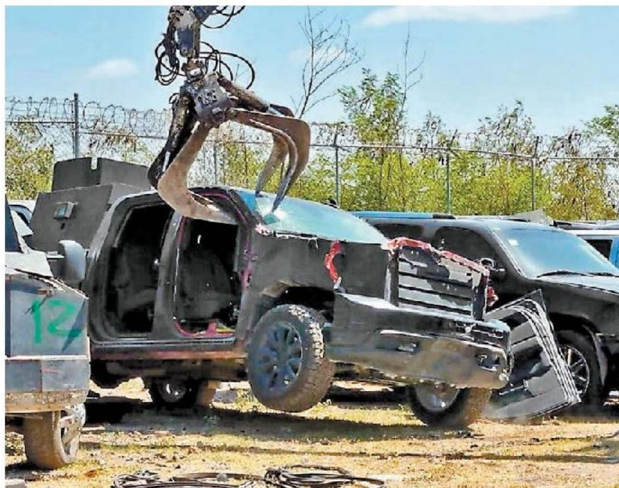
Camioneta desbaratada por autoridades en la ciudad fronteriza.

Los vehículos blindados están relacionados con 13 carpetas de investigación que se originaron por diversos delitos, entre ellos enfrentamientos entre las fuerzas federales con integrantes de las citadas organizaciones criminales, así como por ataques contra autoridades policíacas y por disputas entre los mismos grupos delictivos. —