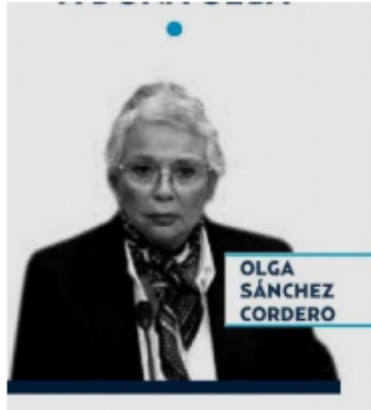
OLGA SÁNCHEZ CORDERO

› Título de Investigadora Ad Vitam recibió la senadora y ex ministra de la Corte, Olga Sánchez Cordero . La Academia Interamericana de Derechos Humanos y la Universidad Autónoma de Coahuila le otorgaron el reconocimiento por sus más de 50 años de trabajo en la defensa de los derechos de las mujeres y la diversidad. La homenajeadá agradeció el grado y se comprometió a seguir colaborando "juntos en la progresividad de todos los derechos, para todas las personas".