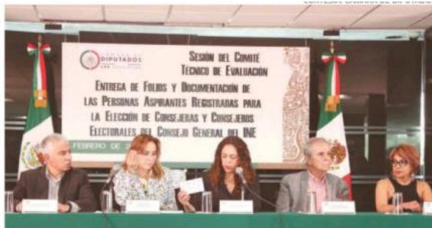
Integrantes del Comité Técnico de Evaluación