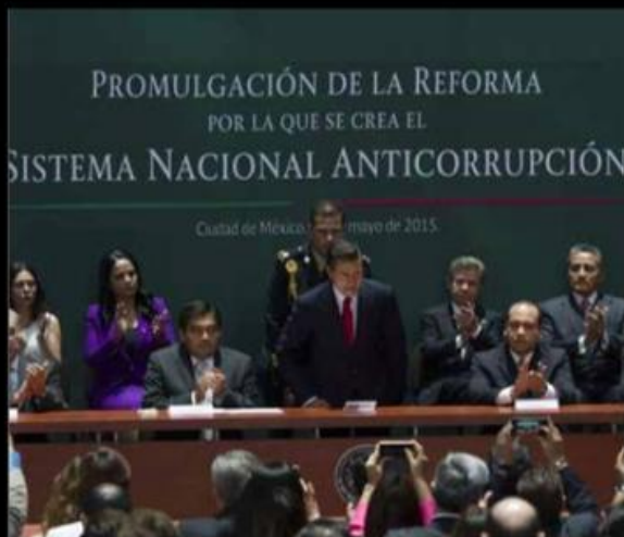
PROMULGACIÓN DE LA REFORMA POR LA QUE SE CREA EL SISTEMA NACIONAL ANTICORRUPCIÓN

El 18 de julio de 2016, el Congreso aprobó su Ley General. En abril de 2023 la SESNA, que ha sido fundamental en este edificio legal, enfrenta su eventual fin mientras la corrupción continúa sin freno.