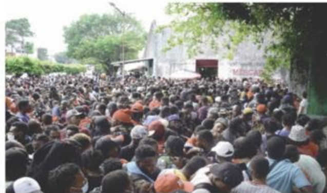
AGLOMERACIÓN de migrantes en la Comar de Tapachula, el pasado 2 de enero.

ENTRE EL 2019 Y 2022 se han registrado más de 361 mil solicitudes de refugio; dependencia justifica que por la emergencia sanitaria de Covid-19 suspendieron los tiempos de reacción