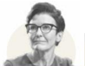
JANE FRASER Directora general de Citi

“Continuaremos invirtiendo y haciendo crecer nuestra franquicia institucional, líder en la industria”