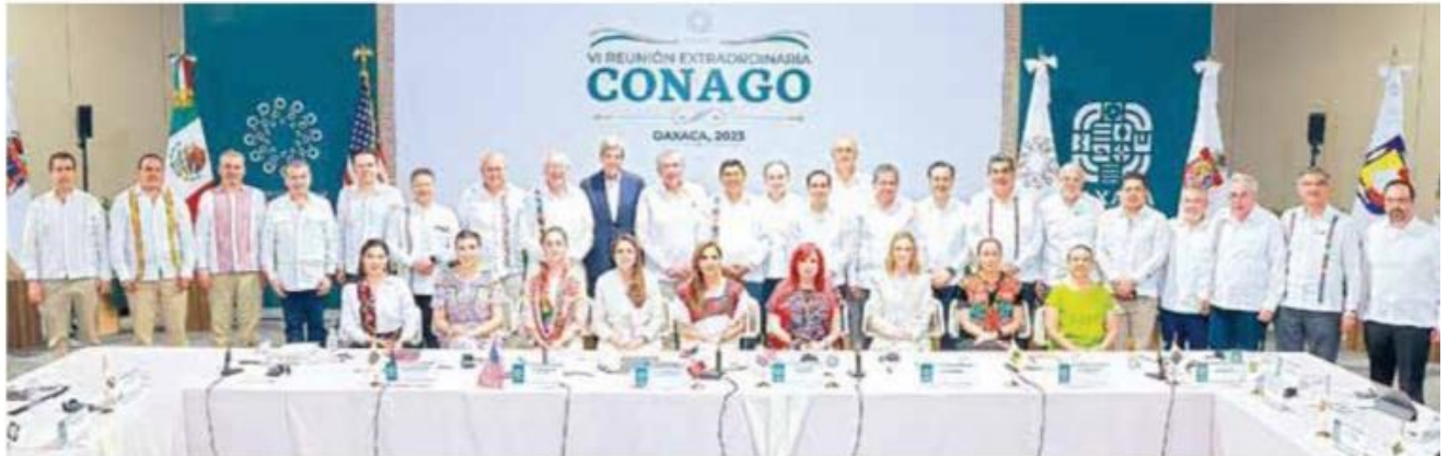
Diálogo con la federación.

madurez y poder darle respuesta a las necesidades que cada uno de nosotros representa.