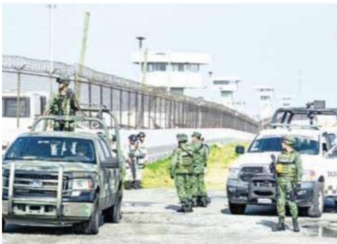
Garantizar la paz social.

En su cuenta de Twitter, Luisa María Alcalde apuntó: “Agradezco la confianza del presidente López Obrador al nombrarme secretaria de Gobernación. Será, sin duda, el honor de mi vida acompañarlo desde esa nueva responsabilidad en esta última etapa fundamental para la consolidación de la transformación”. V