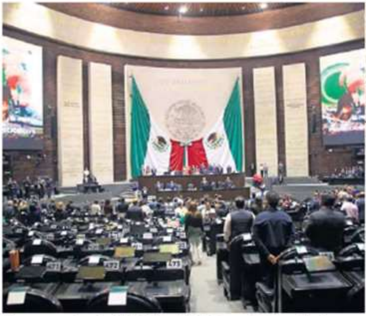
GERMÁN ESPINOSA. EL UNIVERSAL

60% AUMENTARÁ la deuda nacional de aprobarse el Presupuesto de Egresos de la Federación para 2024.