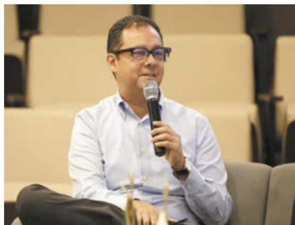
YORIO. Se busca unir esfuerzos para fortalecer el desarrollo del sur-sureste del país.

Destaca subsecretario de Hacienda que sus economías avanzan a un ritmo de 6%