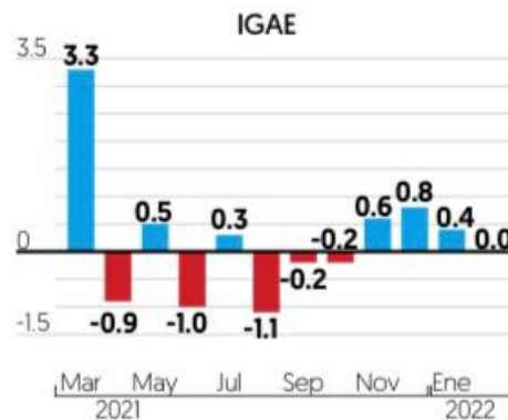
■ Variación porcentual mensual