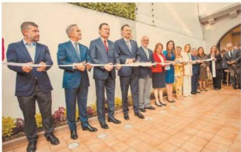
Kuri señala que se trata de un espacio de enlace y punto de encuentro para quien quiera descubrir más de Querétaro .