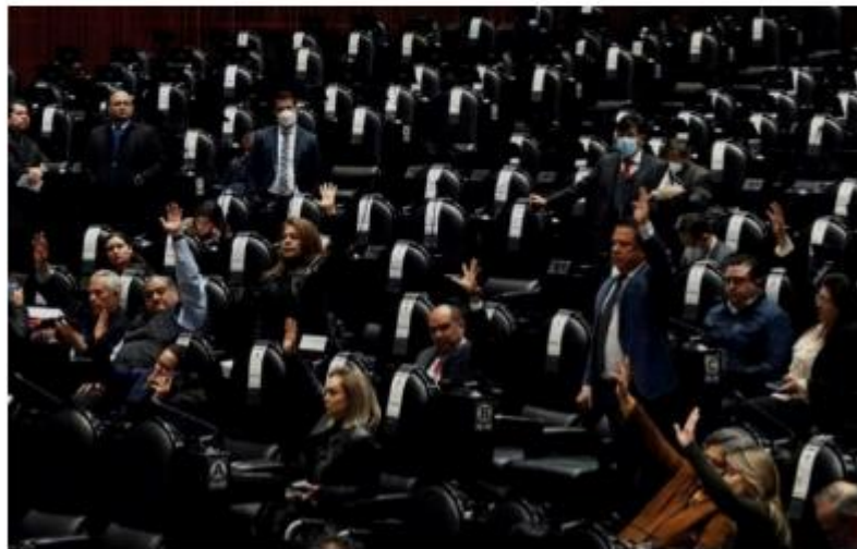
La Cámara de Diputados.