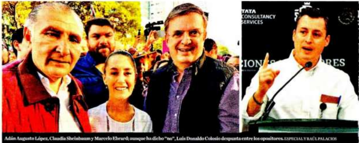
Adán Augusto López, Claudia Sheinbaum y Marcelo Ebrard; aunque ha dicho "no", Luis Donald Colosio despunta entre los opositores.