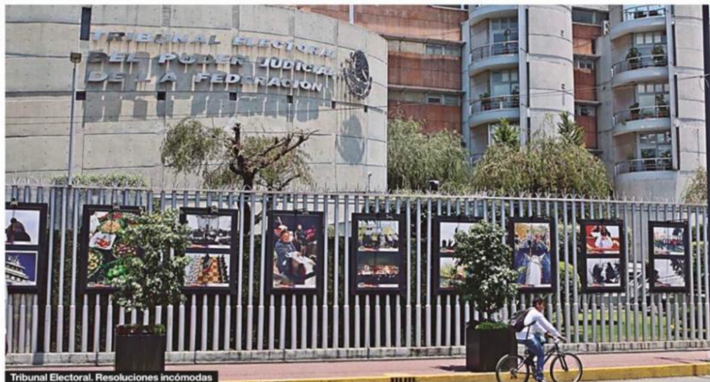
Tribunal Electoral. Resoluciones incómodas