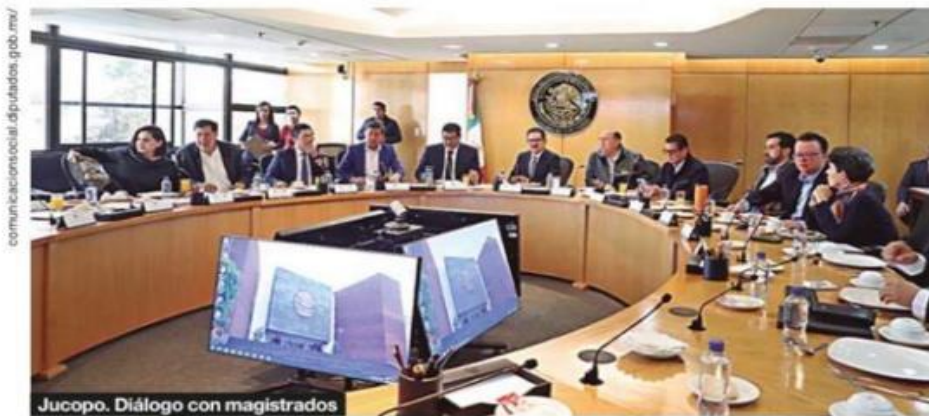
Jucopo. Diálogo con magistrados

Aunque hubo enorme énfasis en que la reunión no era para negociar las reso-