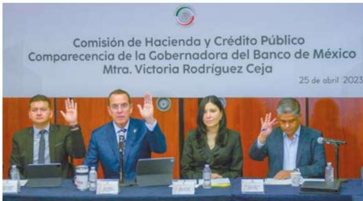
Asistencia. La gobernadora de Banxico, Victoria Rodríguez Ceja, en su comparecencia en el Senado de la República.

Coincidió en que ahora lo relevante será determinar por cuánto tiempo la tasa se mantendrá elevada, lo que dependerá de la evolución de la inflación y de la economía, principalmente porque hay una alta probabilidad de una desaceleración importante en este año.