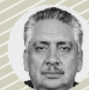
Guadalupe Acosta Naranjo Expresidente del PRD

"Vayamos por la candidatura más competitiva. Pedir un millón de firmas [para obtener la postulación] es ridículo"