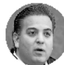
Damián Zepeda Vidales Expresidente del PAN y senador

"Veo a una oposición muy desorganizada, sin claridad sobre cuál será el método, los tiempos para elegir a un candidato opositor"