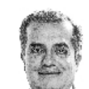
Luis Carlos Ugalde Expresidente del extinto IFE

"Esto es consustancial a los procesos de selección de candidaturas. No deberíamos preocuparnos demasiado"