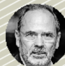
Gustavo Madero Muñoz Expresidente del PAN y senador

"Si la oposición se pone de acuerdo, si sacan un candidato de consenso, sobre todo, si está legitimado, podrían competir"