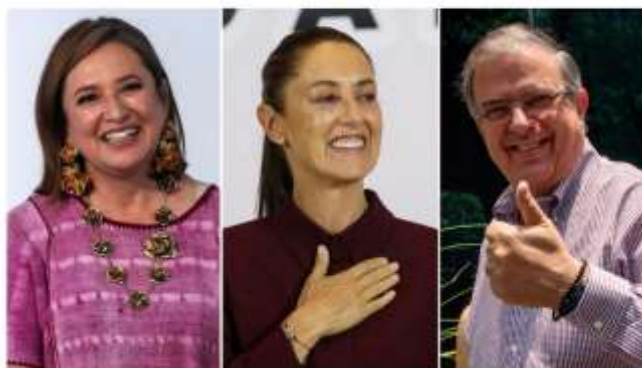
Las postulantonas a la presidencia de México: Xóchitl Gálvez, Claudia Sheinbaum y Marcelo Ebrard