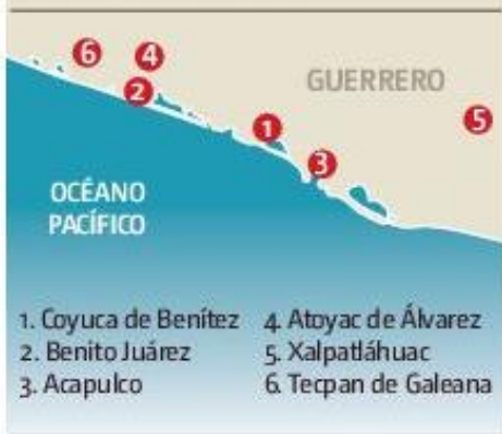
Afectaciones en la ciudad costera de Acapulco.

Coyuca de Benítez, Benito Juárez, Acapulco, Atoyac de Álvarez, Xalpatláhuac y Tecpan de Galeana fueron declarados zonas de desastre por el gobierno federal