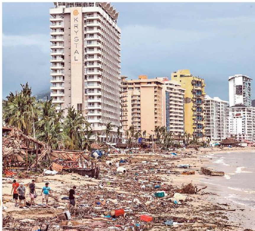
Bienestar comenzó censo de damnificados con enviados de Siervos de la Nación.

— Hoteleros calculan en 95% el “colapso” de la infraestructura turística de Acapulco por Otis , que mató a 27 personas y provocó pérdidas por 15 mil mdd. PÁGS. 6 Y 7