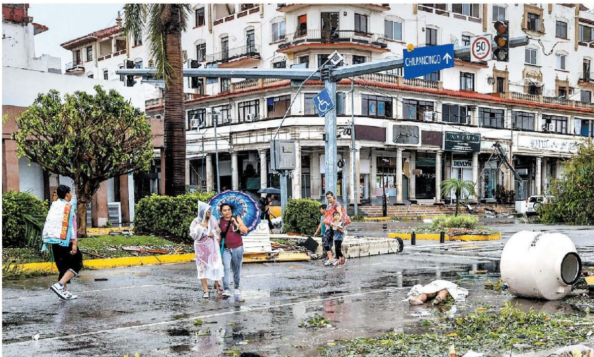
Pobladores caminan frente a un cuerpo junto a los escombros tras el paso del fenómeno natural en el puerto.