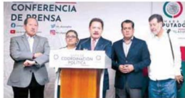
www.nacion.com | @gobmx