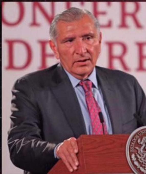
Adán Augusto López Hernández, secretario de Gobernación, dio a conocer durante la conferencia mañanera algunos detalles del ejercicio participativo.

Mientras la iniciativa que buscaba extender las labores del Ejército en las tareas de seguridad pública del país se discute de nuevo en comisiones, los legisladores de las diversas bancadas intentan alcanzar un punto medio para poder sacar el tema adelante