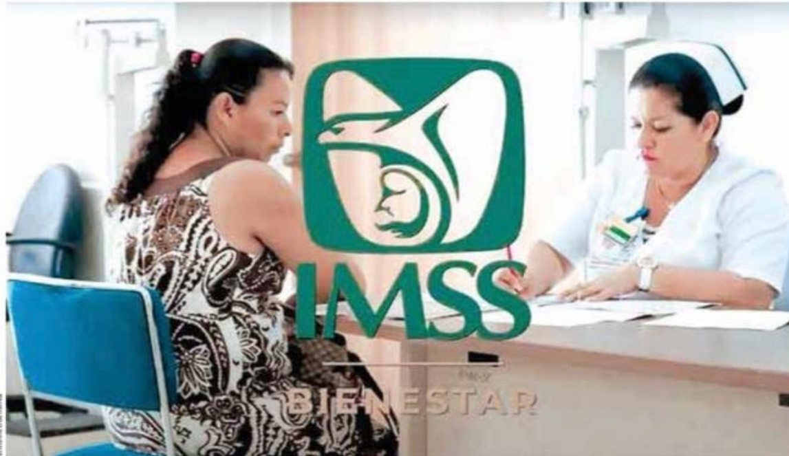
Institución central en el nuevo modelo.

“Significará una inversión de alrededor de 200 mil millones de pesos”.