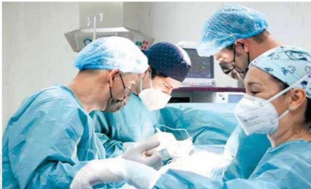
Supervisión de hospitales a nivel nacional.

Institutos Nacionales de Salud y Hospitales de Alta Especialidad con 28 vacantes”.