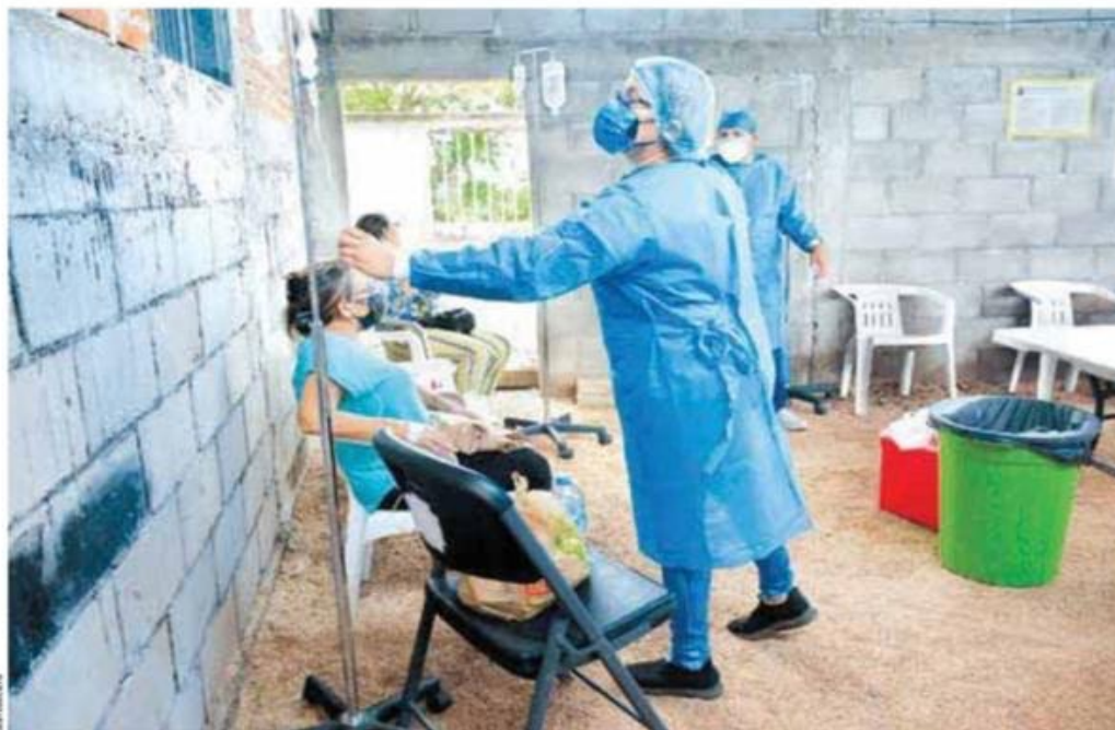
Apoyo a los que no tienen seguridad social.

“Un sistema de salud que garantice la atención integral”.