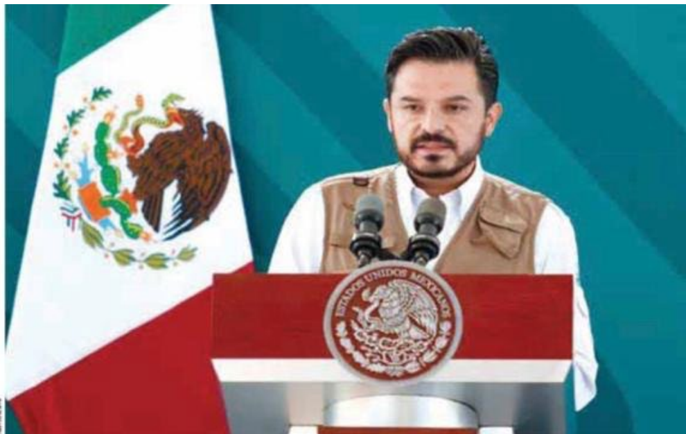
Robledo | Integración paulatina de los sistemas estatales.

Indicó que la transformación del sistema de salud representa contratar a más personal, invertir en infraestructura y en procesos de fiscalización.