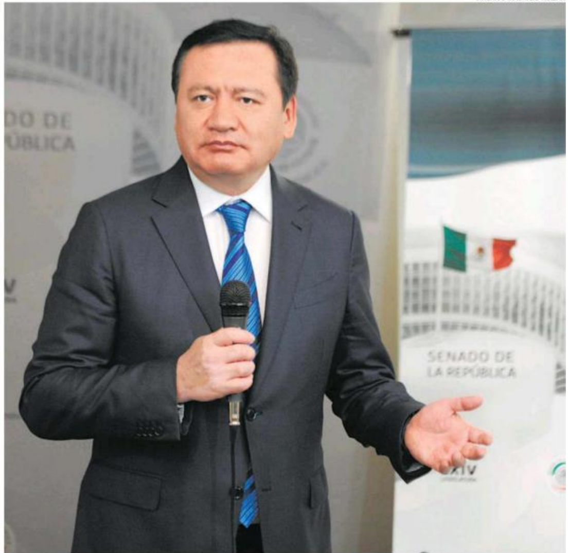
El senador priista confía en que lograrán ganar la elección presidencial