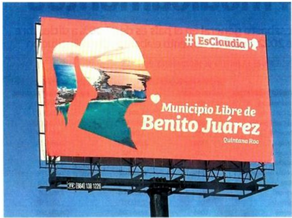
La bancada de Movimiento Ciudadano en la Cámara de Diputados acusa la colocación de espectaculares en al menos 20 ciudades del país, acción que varios diputados de Morena se adjudican.