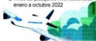
■ Miles de pasajeros internacionales enero a octubre 2022

Al décimo mes del año, el aeropuerto de Cancún fue el que más movilizó a viajeros internacionales con el 37.7%.