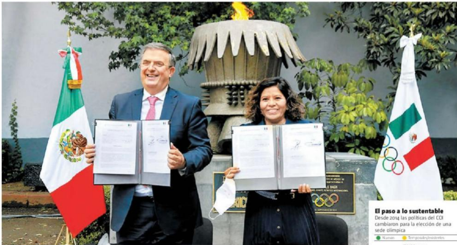
El canciller Marcelo Ebrard y María José Alcalá.