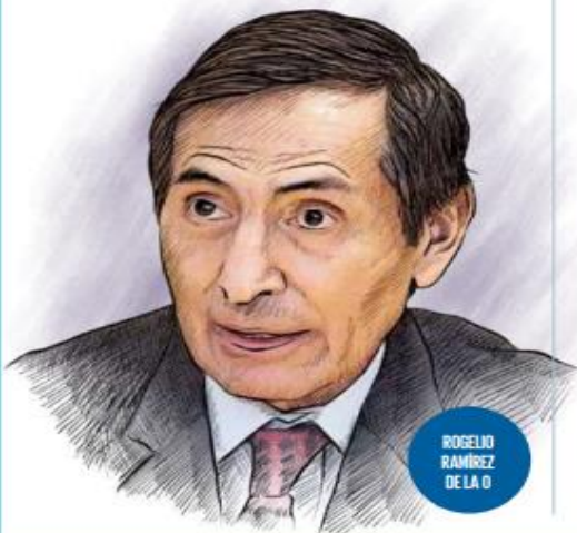
ROGELIO RAMÍREZ DE LA O

— C ON UNA SOLA jugada de off side , la Secretaría de Hacienda dejó fuera del equipo de la Financiera Nacional de Desarrollo (FND) a los funcionarios impuestos por Raquel Buenrostro , la secretaria de Economía.