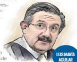
LUIS MARÍA AGUILAR