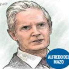
ALFREDO DEL MAZO