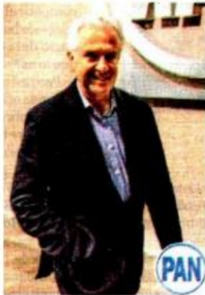
Santiago Creel.