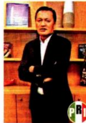
Osorio Chong.