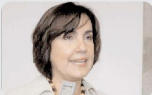
Patricia Mercado Castro