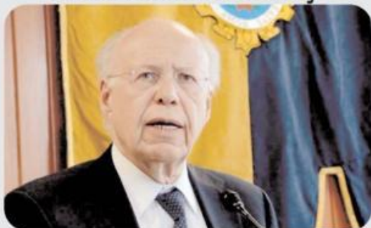
José Ramón Narro Robles