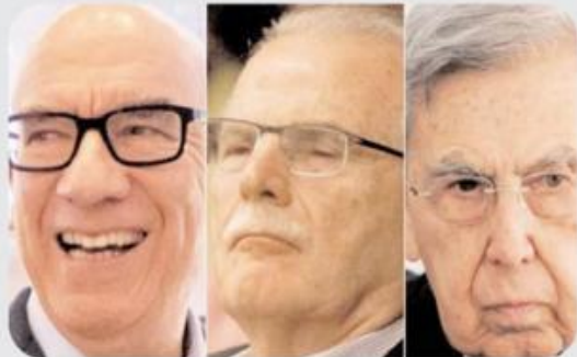
Dante Delgado, Francisco Labastida y Cuauhtémoc Cárdenas