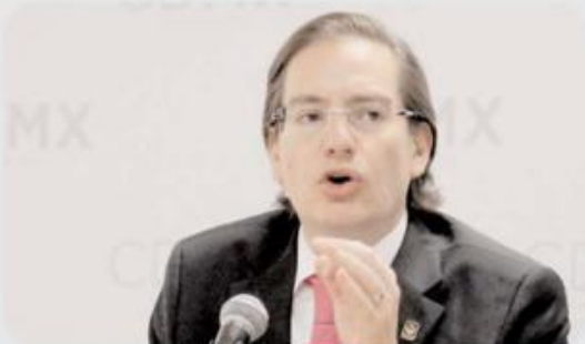
Salomón Chertorivski Woldenberg