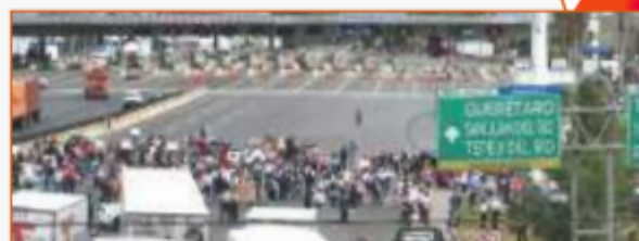
LA CASETA de Tepotzotlán, en la carretera México-Querétaro, fue uno de los puntos bloqueados ayer.