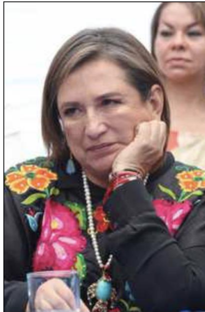
▲ Ayer se realizó la reunión plenaria del grupo parlamentario del Partido Acción Nacional. Estuvo presente, entre muchos miembros del blanquiazul, Xóchitl Gálvez.

competencia, significará darle la razón al presidente López Obrador. Desde principios del mes pasado había revelado que la candidata sería Xóchitl Gálvez, porque el jefe de los grupos de oposición de derecha, Claudio X. González, así lo había arreglado con los machuchones que pondrán billetes para la campaña. Entonces todo habría sido una farsa. Desde la formación del Frente Amplio, el registro de aspirantes, la eliminatoria, en fin, todo habría sido una pantomima cuyo final se conocía de antemano: