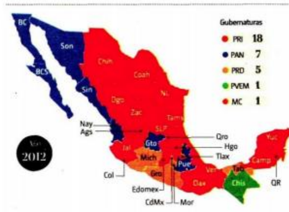
Gubernaturas de principales partidos