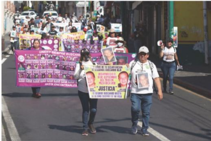
INTEGRANTES de la Brigada Nacional de Búsqueda, durante una marcha el 27 de noviembre pasado.

ACTIVISTAS CONSIDERAN que si bien hay algunos avances, como la creación del Mecanismo de Identificación Forense, fue un año perdido; varias buscadoras se encuentran amenazadas por el crimen organizado, advierten