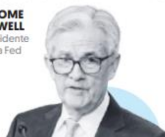
JEROME POWELL Presidente de la Fed

“Los registros históricos advierten fuertemente contra la relajación prematura...”