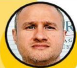
Édgar Valdez Villarreal La Barbie 192,000,000