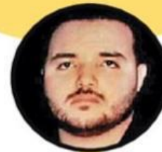
Ismael Zambada Imperial El Mayito 5,000,000