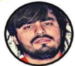
Dámaso López Serrano El Mini Lic 1,000,000