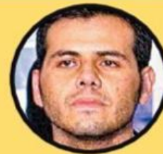
Ismael Zambada Niebla El Vicentillo 1,373,415,000