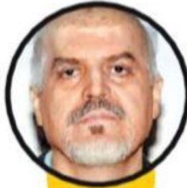
Eduardo Arellano Félix El Doctor 50.000.000