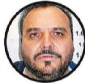
Jesús Zambada García El Rey Desconocido

sentenciado a pasar 15 años en prisión. Aceptó la entrega de mil 373 millones de dólares, según documentos de Illinois.