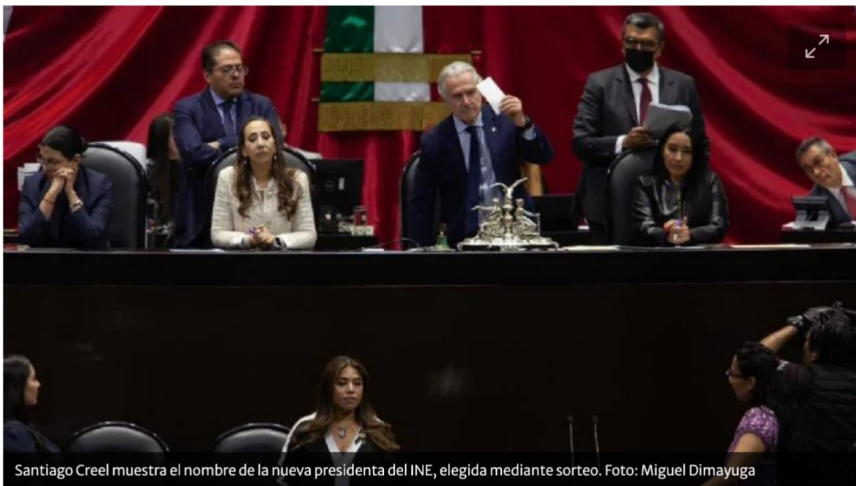
Santiago Creel muestra el nombre de la nueva presidenta del INE, elegida mediante sorteo.