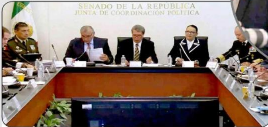
Adán Augusto López Hernández

están a merced de las organizaciones criminales o del crimen organizado", apuntó.