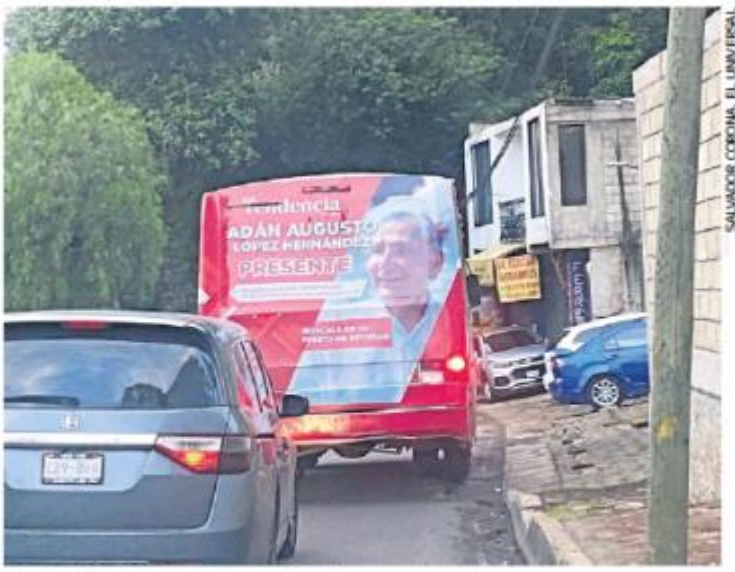
El extitular de la Secretaría de Gobernación, Adán Augusto López, cuenta con 952 anuncios de propaganda, indica el INE.

1,342 ELEMENTOS DE PROPAGANDA tiene Claudia Sheinbaum en apoyo a su aspiración presidencial.