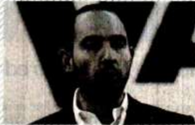
MARKO CORTÉS MENDOZA Presidente nacional del PAN

PAN, PRD, MC Y PRI se unen en la defensa de la democracia y la Constitución y anuncian que pelearán por las facultades del INE, de los tribunales y por unas elecciones libres.