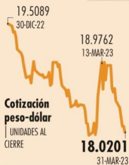
Cotización peso-dólar UNIDADES AL CIERRE