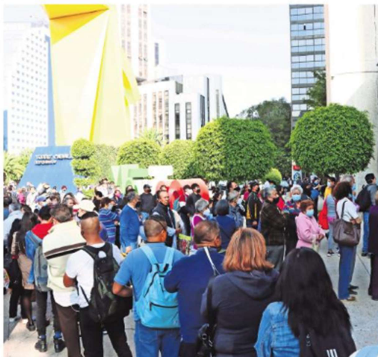
Durante el primer semestre de este año el total de atenciones a contribuyentes en el SAT fue de 20.8 millones, de las cuales 12 millones se llevaron a cabo presencialmente.

Así, durante el primer semestre del año en curso el total de atenciones al contribuyente en el SAT fue de 20.8 millones, de las cuales un poco más de 12 millones fueron presenciales y 8.8