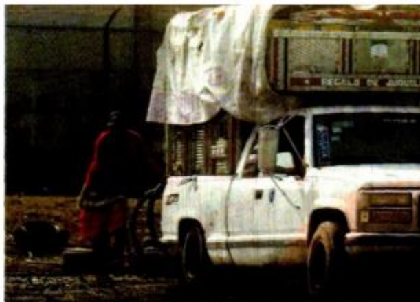
Junto al Circuito Exterior Mexiquense se encuentra la toma donde más se roban el agua, la zona es vigilada por halcones.