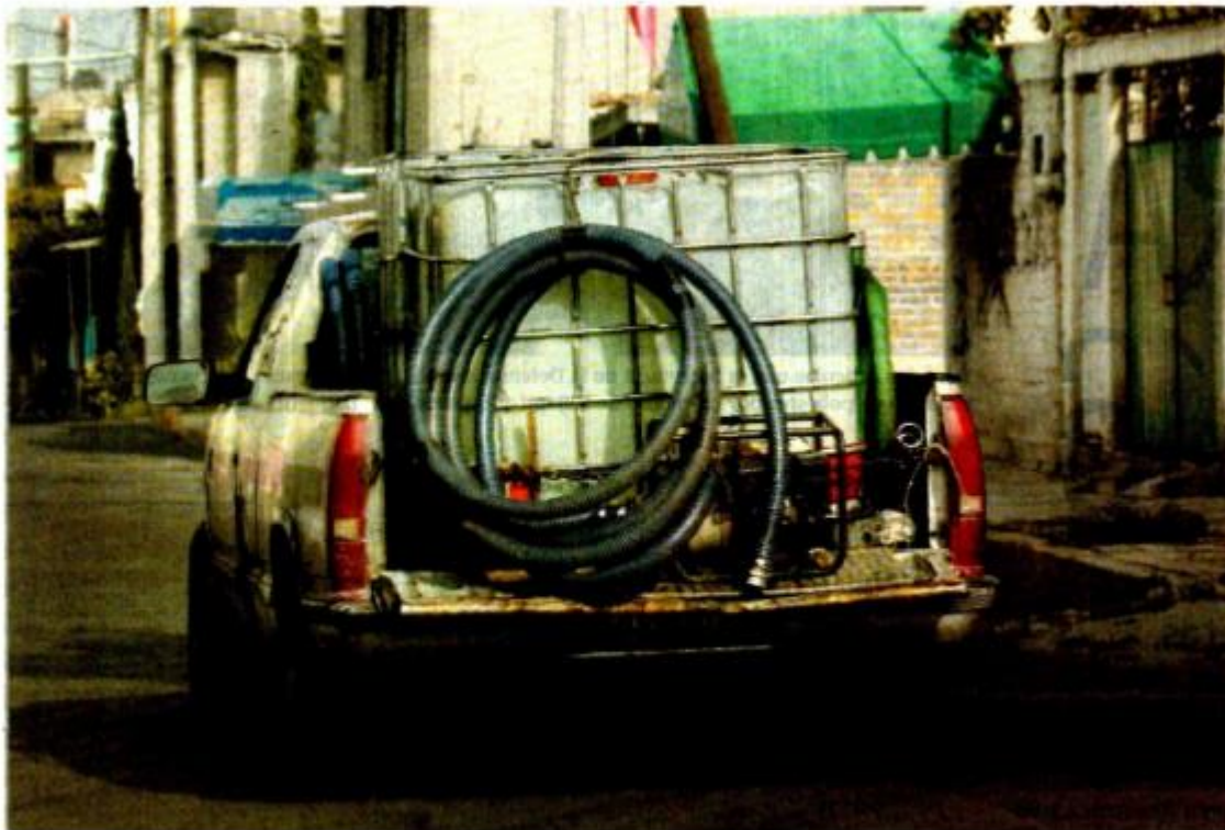
A plena luz del día se ve el paso de vehículos con bidones que llenan en minutos para después venderla a los vecinos de la misma zona; en momentos hay hasta tres unidades esperando su turno para robar el agua.