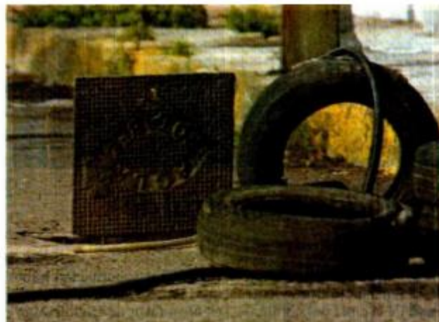
Las tomas clandestinas están conectadas a través de mangueras a casas donde colocan depósitos para almacenar el agua.