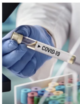
La pandemia amplió las desigualdades preexistentes.

En su informe anual sobre reformas estructurales, la OCDE reportó que México tiene un índice de brecha de pobreza de 34.2, por encima del promedio de 28.7 del resto de los países